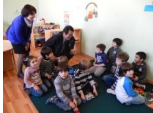
オルタチャラ地区 145 幼稚園視察