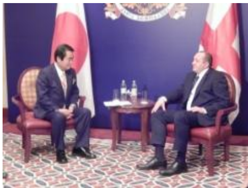
マルグヴェラシヴィリ大統領への表敬

11月16日から18日まで、牧野たかお外務大臣政務官はグルジアのトビリシを訪問し、大統領就任式へ総理特使として出席したほか、マルグヴェラシヴィリ大統領をはじめとする同国政府要人と会談等を行ったところ、概要は以下のとおりです。