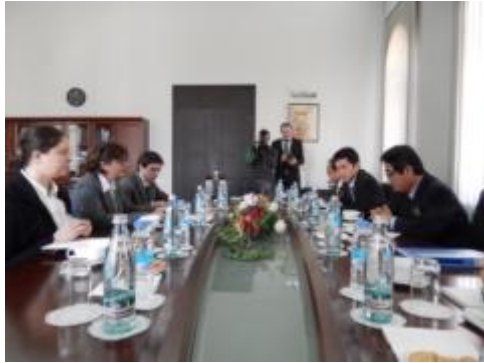
パンジキゼ外相との会談